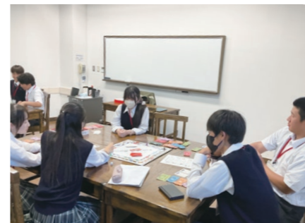
グローバルスタディーズキャンプ(GSC 4年) プリティッシュヒルズ

各分野で活躍されている専門家に講義をしていただいたり、外国人の方との交流を行ったりしながら、グローバルな視点で様々な課題を捉え、その解決策を考えます。