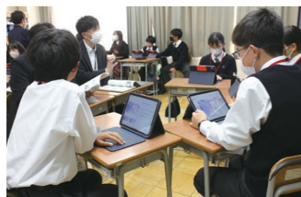
市役所の方々への政策提案

探究の方法を学ぶため、まずは身近な伊勢崎市の諸課題についてグループで調査を行います。市役所の方々から直接お話をうかがったり、大学の先生の講義を受けたりしながら、探究のスキルを身に付け、まとめとして伊勢崎市に政策提案を行います。