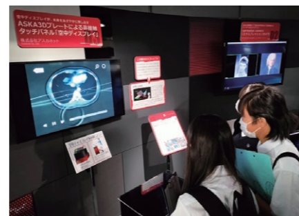
ナノ医療イノベーションセンター

それぞれの探究テーマを探るべく、都内の国際機関や企業、大学を中心に1泊2日で最先端の知識や本物の技術に触れ、更なる探究心を育みます。期間中、その分野のエキスパートの方々から特別講義を受けます。