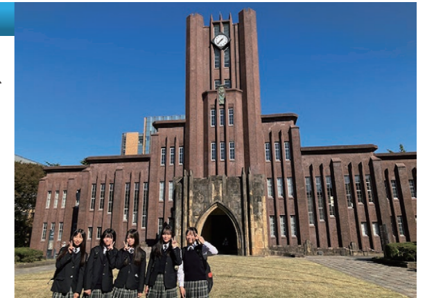
東京大学 安田講堂

大学で学ぶ意義やその学びの実態を深く理解したり、実感できるように、実際に都内の大学を訪問します。大学の講義を聴いたり研究室を見学したりすることが進路について具体的に考えるきっかけになります。