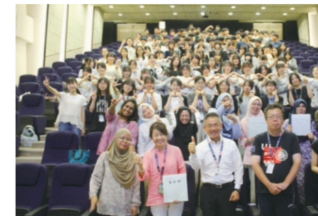
ウーロンゴン大学 マレーシア校

1年生から積み重ねてきたグローバル学習の集大成となる研修です。体験活動や専門家による講義を通して、グローバル社会で活躍していくための資質を養います。