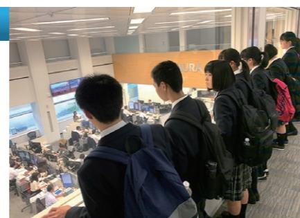
野村ホールディングス

都内の一流企業や官公庁を訪問し、仕事を通して生活や社会をより豊かにすることをめざす職場の実態を学びます。この活動を通して働くことと学ぶことの関連に気付き、自分自身の将来の進路について考えるきっかけとします。