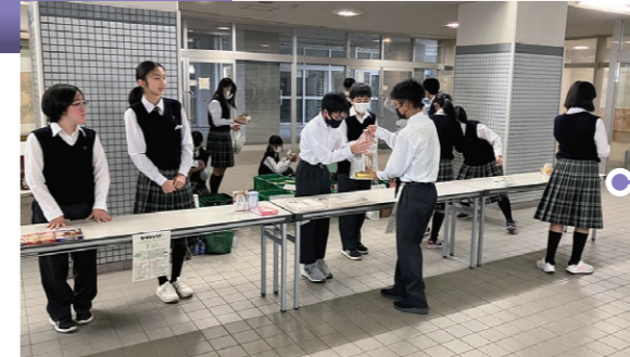
フードドライブ 本校エントランスホール

本校の6年間を貫く総合的な学習や探究活動の柱にSDGs学習があります。専門家の講義や様々な体験学習を通して教養を身につけ、自ら興味を持った分野について探究します。