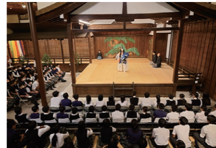
能と狂言 大江能楽堂