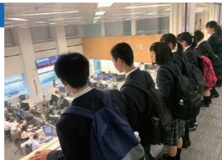
野村ホールディングス

都内の一流企業や官公庁を訪問し、働く場としての企業や公衆に奉仕する仕事の実態を学びます。この活動を通して、自らが働くことと学ぶことの関連に気付き、自分自身の将来の進路について考えるきっかけとします。