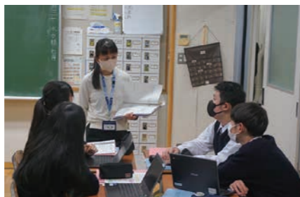
市役所の方々への政策提案

探究の方法を学ぶため、まずは身近な伊勢崎市の諸課題についてグループで調査を行います。市役所の方々から直接お話をうかがったり、大学の先生の講義を受けたりしながら、探究のスキルを身に付け、まとめとして伊勢崎市に政策提案を行います。