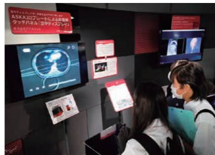
ナノ医療イノベーションセンター

それぞれの研究テーマを探るべく、都内の国際機関や企業、大学を中心に1泊2日で最先端の知識や本物の技術に触れ、さらなる探究心を育みます。期間中、その分野のエキスパートの方々から特別講義を受けます。