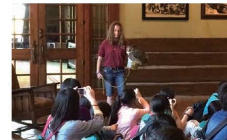
ミズーリ州立大学

1年生から積み重ねてきたグローバル学習の集大成となる研修です。様々なコースに分かれ、体験活動や専門家による講義を通して、グローバル社会で活躍していくための資質を養います。